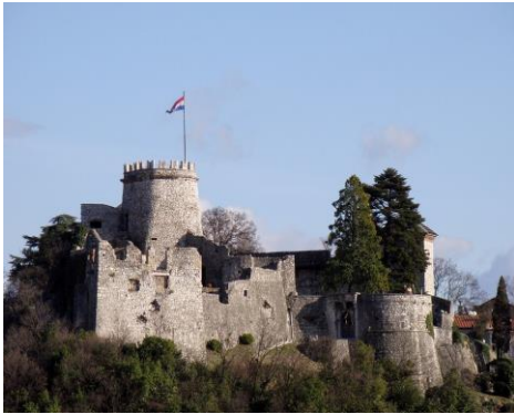
Château de Trsat

LE PARC NATIONAL DES LACS DE PLITVICE se situe à mi-chemin entre les villes de Zagreb et Zadar au sein d'un plateau karstique. C'est à la fois le plus vieux des parcs nationaux du Sud de l'Europe et le plus grand de Croatie. Il est sur la liste du patrimoine mondial de l'UNESCO depuis 1979. Ce parc comprend non seulement les lacs de Plitvice (en croate Plitvička jezera), qui forment un ensemble de seize grands lacs, reliés entre eux par 92 cascades ou de petites rivières tourmentées, mais aussi la forêt environnante composée principalement de hêtres et de pins et qui abrite de nombreuses espèces animales (dont l'ours brun et le loup). La faune et la flore y sont prospères comme en témoigne la richesse piscicole des lacs.