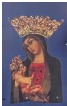
Notre Dame de Trsat