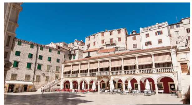
Vielle ville de Sibenik