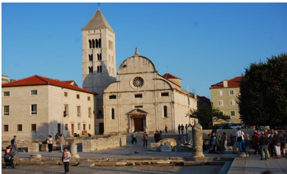
Centre historique de Zadar

Avec la ville trimillénaire de Zadar, la majestueuse et animée ville de Split, construite dans les murs mêmes de l'ancien palais de l'Empereur Dioclétien, la mythique Dubrovnik, sans oublier Sibenik et sa célèbre cathédrale, la Dalmatie regorge d'étapes culturelles incontournables. Dotée de la beauté sauvage de la roche blanchâtre du karst, d'une végétation méditerranéenne et subtropicale, ainsi que d'innombrables îlots bordés par une mer bleue cristalline, la Dalmatie est un véritable paradis sur terre.