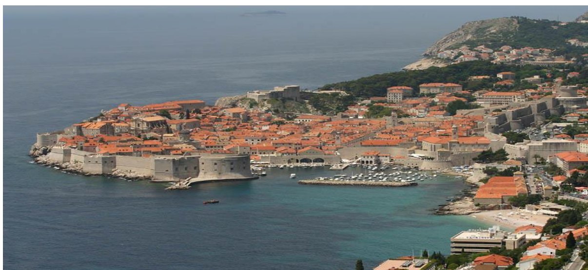
Vue de Dubrovnik et de ses remparts

Direction et animation spirituelle : Père Ludovic NOBEL - Fribourg Tél. 026/309 26 64 - Portable : 079/506 29 30 - E-mail : ludovicnobel@bluwin.ch