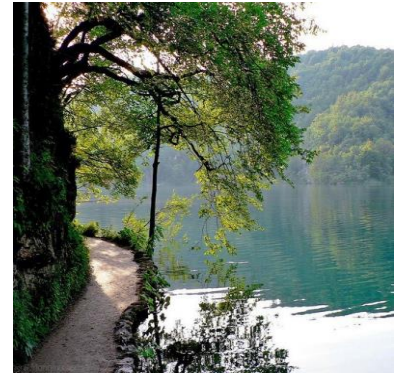
Lacs de Plitvice