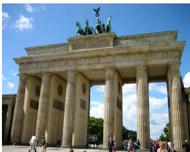
Berlin - Porte de Brandebourg