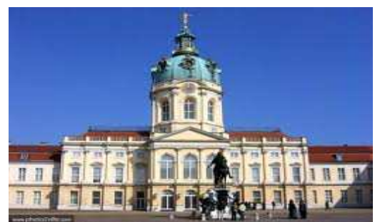
Berlin - Château de Charlottenburg