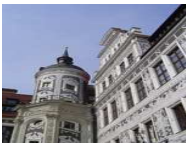
Dresde - Château de la Résidence