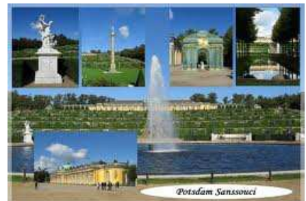
Potsdam – Palais de Sanssouci