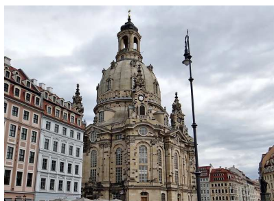
Dresde -la Frauenkirche