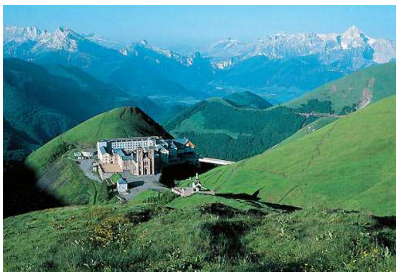
Le sanctuaire de Notre-Dame de la Salette