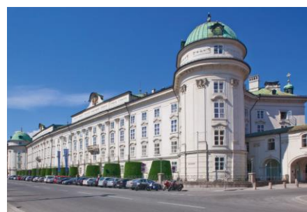
Palais Impérial Innsbruck