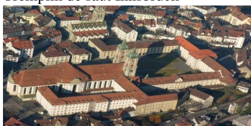
Abbaye St Gall