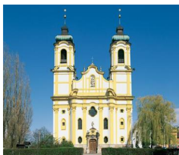
Basilique de Wilten Innsbruck