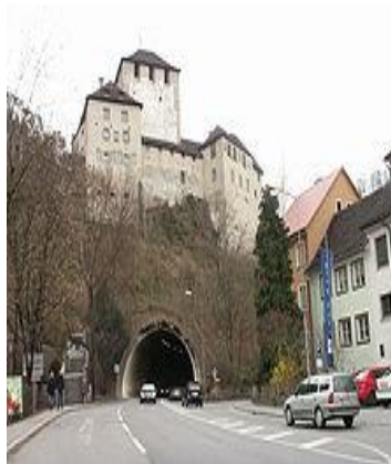
Château des Schatten Feldkirch

Tél. 079/506 29 30 - E-Mail : ludovicnobel@bluewin.ch