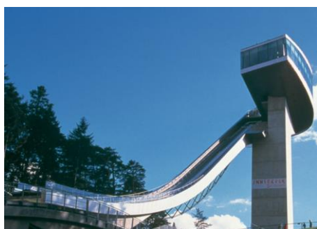
Tremplin de saut Innsbruck