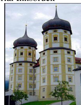
Abbaye de Stams