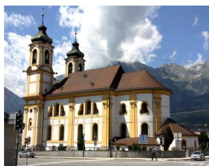
Cathédrale St Jacques