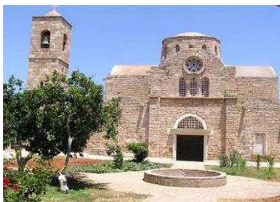
Monastère de Saint-Barnabé