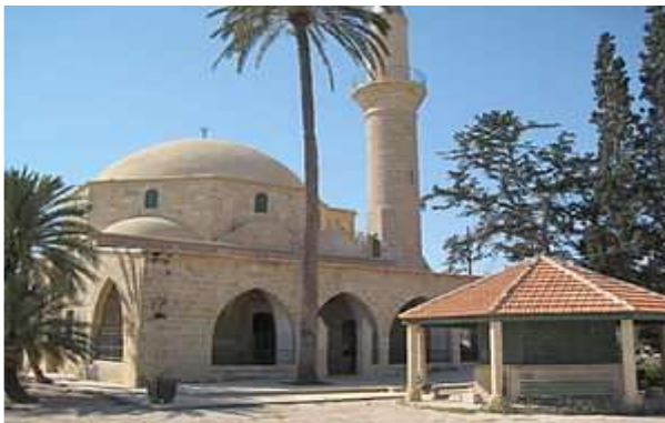
Mosquée Hala Sultan Larnaca