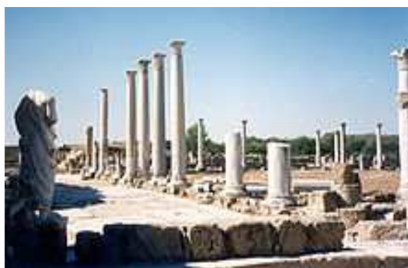
Gymnase de Salamine