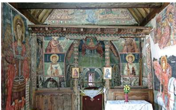
Eglise Archangelos Michail à Pédoulas