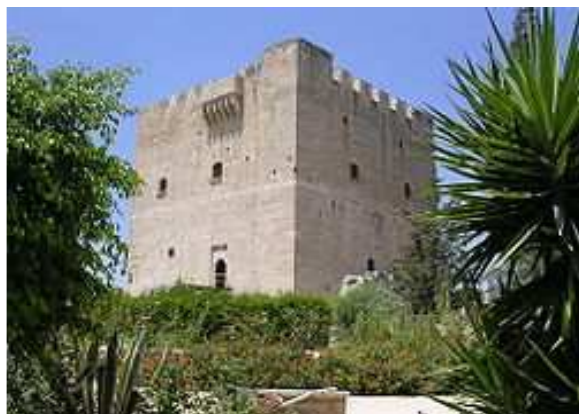
Fort de Kolossi