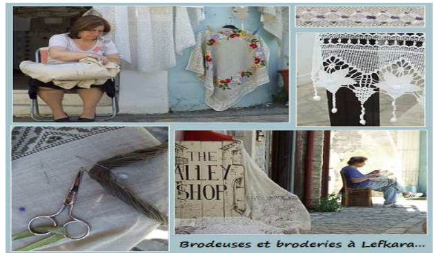
Lefkara – brodeuses