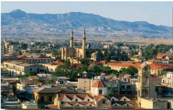
Vue générale de Nicosie