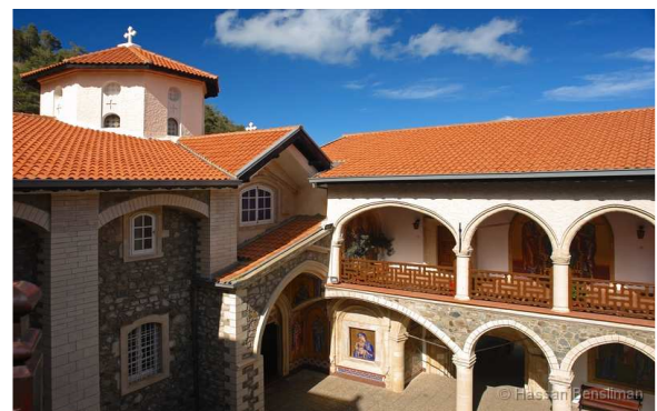
Monastère de Kykkos