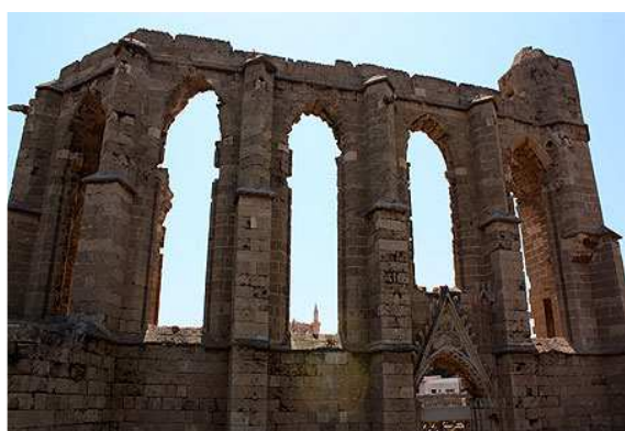
Ruines Eglise St Georges Famagouste