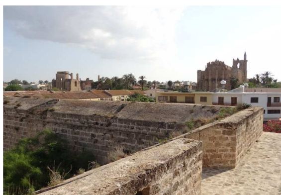
Remparts de Famagouste