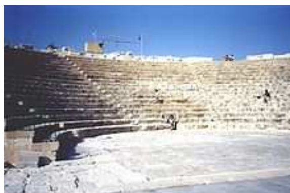
Théâtre de Salamine