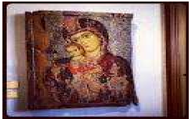
Musée d'art byzantin Nicosie