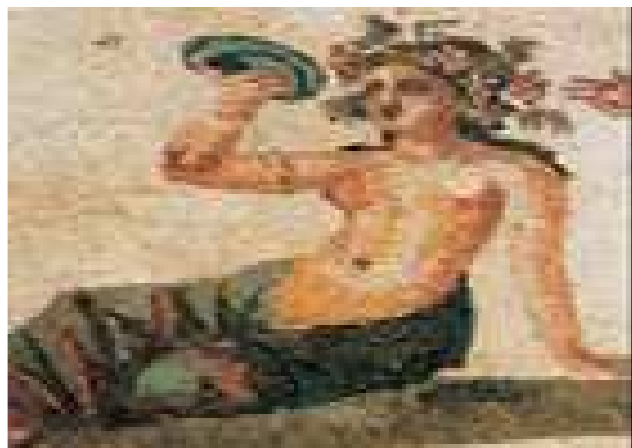
Mosaïques de Paphos