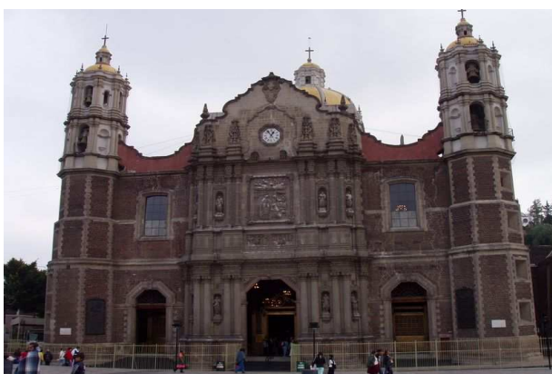
Notre-Dame de Guadeloupe Mexico

● plus de 1 000 000 h. ● de 500 000 à 1 000 000 h. ● de 100 000 à 500 000 h. ● moins de 100 000 h.