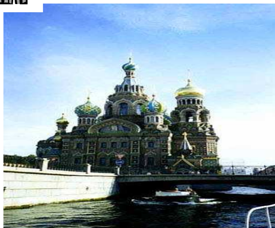
La cathédrale de la Résurrection du Christ