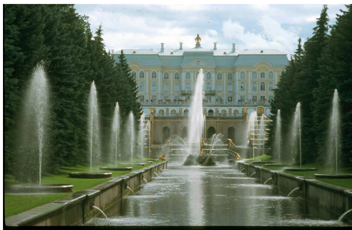
Château de Peterhof