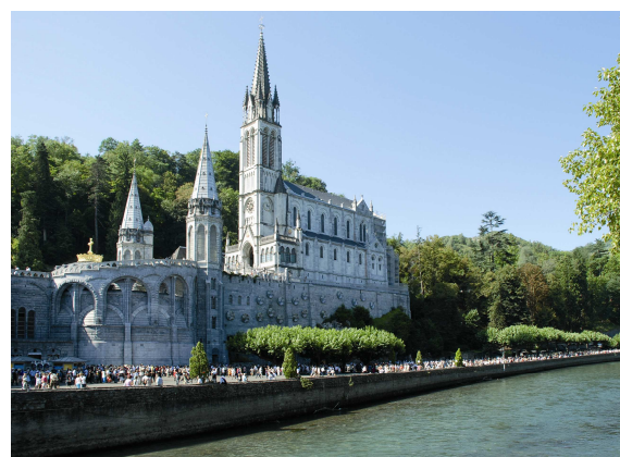
Basilique Notre Dame de Lourdes