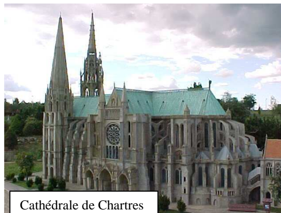
Cathédrale de Chartres