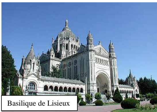
Basilique de Lisieux

A proximité immédiate de nombreuses cathédrales en France des écoles épiscopales, centres intellectuels et théologiques ont été fondés. Celle de Chartres fut l'une des plus célèbres. La philosophie de Platon y servait de base à l'enseignement religieux. Elle prit son essor grâce à saint Fulbert, élève de Gerbert qui devint le pape Sylvestre III (999-1003).