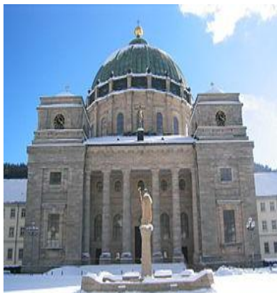
Abbaye Sankt Blasien