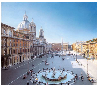
La Place Navona